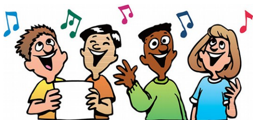
Venerdì 8 luglio - Festival