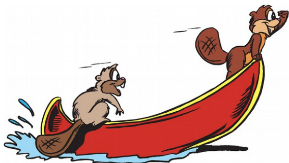
Giovedì 30 giugno - Gita in canoa

Da lunedì a venerdì dalle 15.00 alle 18.30 gli animatori vi aspettano con laboratori, giochi, tornei e tanto divertimento per tutti!