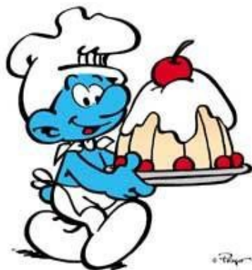
Venerdì 1° luglio - Gara delle Torte