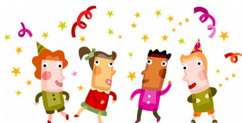
Venerdì 15 luglio - Grande festa finale

Le date delle iniziative possono variare in base alle condizioni del tempo.