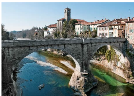
Martedì 5 luglio - Gita a Cividale